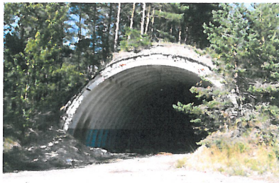
Зенитноракетная бригада в Цирпстене

Lauku ceļotājs («Сельский путешественник») в рамках проекта «Зеленый пояс Балтии» обследовал 80 военных объектов разных времен. Нередко во время железного занавеса для военных целей использовались военные постройки царских времен и Первой мировой войны, поэтому предметом познания служат и многие из них. Мы создали базу данных с фотографиями и описанием о том, для каких целей служили эти секретные объекты, решения о каких событиях там принимались, какое влияние оказывало присутствие армии на повседневную жизнь местных жителей. Каждый объект имеет свою фотогалерею, которая отмечена на карте Google, что позволяет рассмотреть стратегическое расположение объекта на спутниковом снимке. Почти каждый объект имеет свою историю, легенду, шутку, рассказанную очевидцами, чему в базе данных отведен особый раздел. База данных доступна для каждого интересующегося на домашней странице Lauku ceļotājs http://www.celotajs.lv/cont/wrth/military_lv.html .